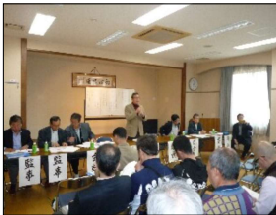
会場風景の一コマ